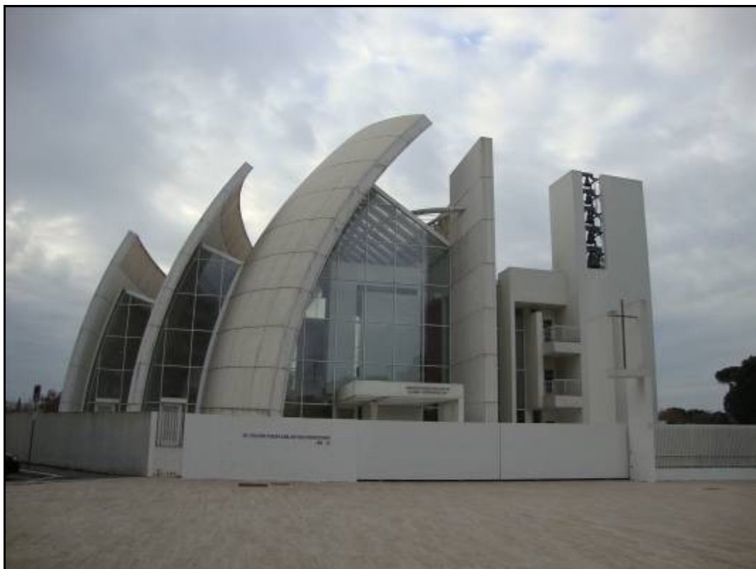
La chiesa 'Dio Padre Misericordioso' a Tor Tre Teste, nota come la 'Chiesa delle Vele'

Il Sentiero, infatti, dopo aver lasciato i resti di Gabii segue il tracciato dell'antica via Prenestina e il percorso degli acquedotti di Galliciano, passando per San Gregorio di Sassola raggiunge il santuario benedettino della Mentorella sul Monte Guadagnolo, il paese di Pisoniano e il ritiro di S. Francesco a Bellegra, i borghi di Roiate e Affile per giungere infine ai Monasteri Benedettini di Subiaco.