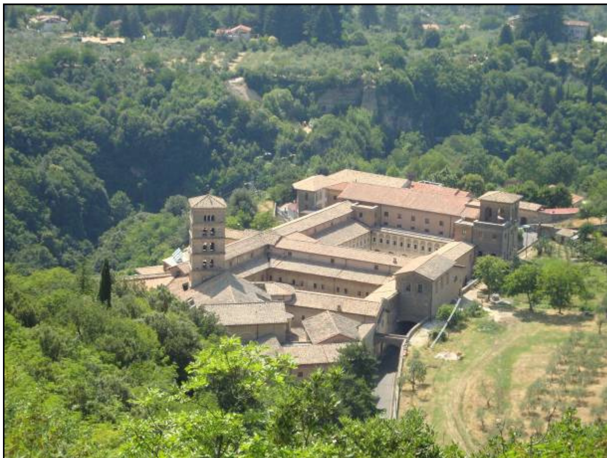
Il monastero di Santa Scolastica e il Sacro Speco a Subiaco