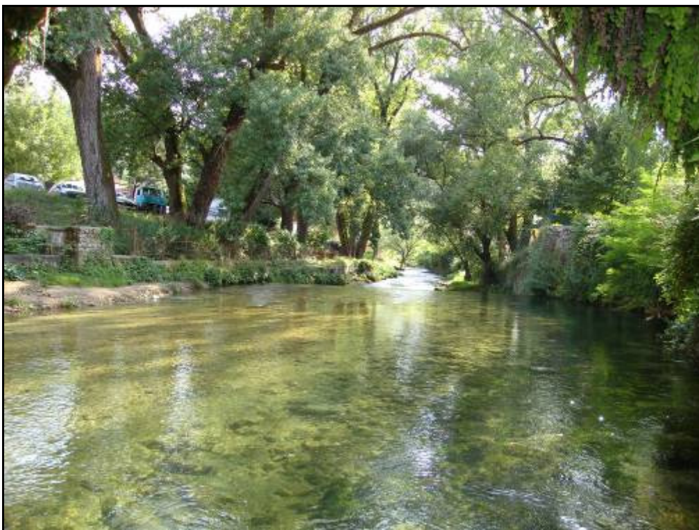
Il fiume Aniene a Subiaco