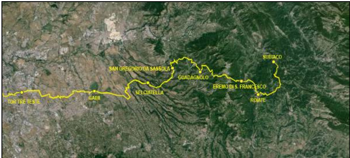
Mapa del Sentiero della Pace

Lungo il cammino che attraverso la campagna, le colline e le montagne della provincia di Roma si incontrano castelli, abbazie, conventi e chiese che testimoniano la lunga storia che caratterizza il territorio posto a sud di Roma.