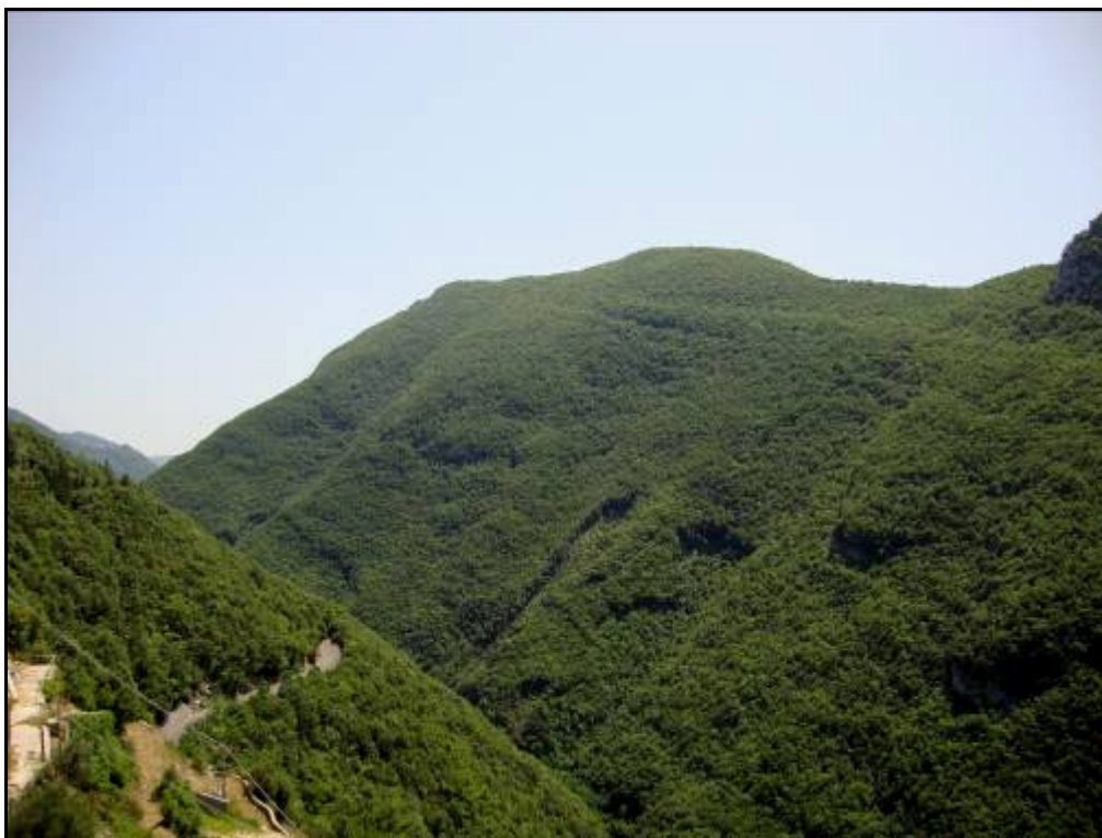
Paesaggio dei Monti Simbruini

Il sentiero si snoda al centro di una vasta area da valorizzare e tutelare il valore naturalistico, storico- archeologico e religioso, per la ricchezza di acque del sistema idrografico della valle dell'alto Aniene che è in stretto rapporto con la più grande area protetta naturalistica del Lazio, il Parco Regionale dei Monti Simbruini.