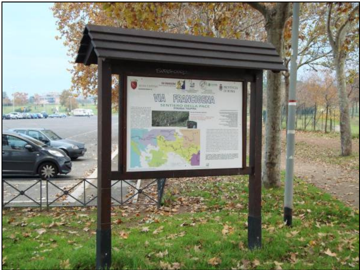
Uno dei tabelloni informativi che accompagnano il percorso del Sentiero nel Parco Palatucci

Il 29 novembre 2011 è stata inaugurata la prima tappa del Sentiero della Pace che permette agli amanti della natura e del trekking di percorrere il tratto iniziale che, partendo dal laghetto del Parco Palatucci a Tor Tre Teste, giunge fino ai resti archeologici dell'antica città latina di Gabii , posta in corrispondenza del lago prosciugato di Castiglione, sulla via Prenestina. Il tratto che attraversa il territorio del Municipio V coincide con la via Francigena, l'antico percorso che, a partire dal medioevo, permetteva ai pellegrini dal nord Europa di giungere a Roma e da qui proseguire per Gerusalemme.